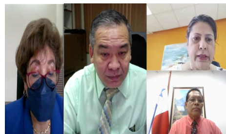
Reunión N°005 del 16 de agosto de 2022