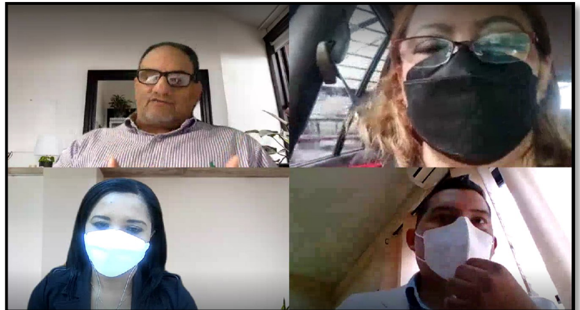
Reunión de la Universidad Santander y Especialistas Evaluadores

La Comisión Técnica de Desarrollo Académico se caracteriza por establecer reuniones de acompañamiento entre universidades particulares y profesores evaluadores, en esta oportunidad; La Comisión de planta docente luego de generar los respectivos informes de evaluación cuatrimestral de las Universidades Particulares, se reúne con las universidades que así lo soliciten, con la finalidad de realizar consultas y esclarecer dudas, referentes a los resultados del informe.