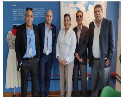
Visita a la Universidad LaSalle por sus tres años de funcionamiento provisional en cumplimiento del Decreto Ejecutivo N° 539 de 2018.