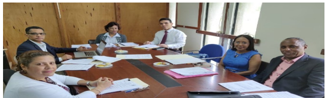
Reunión de Trabajo Comisión de Reglamentación Virtual