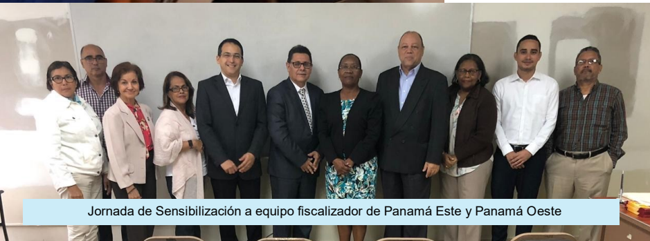
Jornada de Sensibilización a equipo fiscalizador de Panamá Este y Panamá Oeste