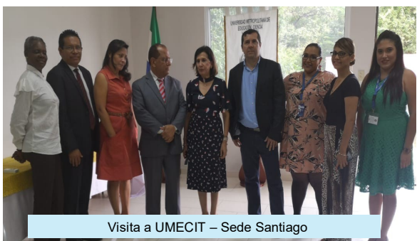
Visita a UMECIT – Sede Santiago

Visita del equipo Fiscalizador de la Universidad de Panamá a las instalaciones de Columbus University— Sede Santiago para la aprobación de apertura de la Sede que permita la oferta de la carrera de Doctor en Medicina y Cirugía.