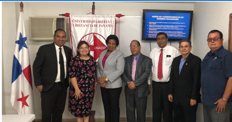
Visita a la Universidad Abierta y a Distancia de Panamá. Sede Santiago