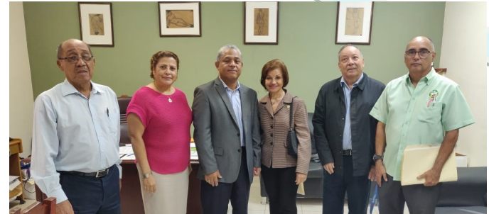
Visita a la Universidad Interamericana de Panamá, Sede La Chorrera