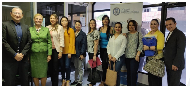
Visita a la Universidad Latina - Sede David