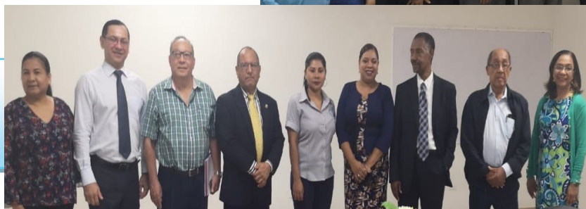
Visita a ISAE Universidad Sede Penonomé