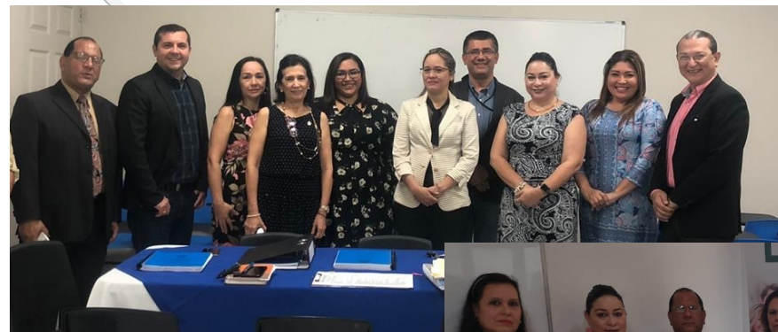
Visita a la Universidad Metropolitana de Educación, Ciencia y Tecnología (UMECIT) Sede David