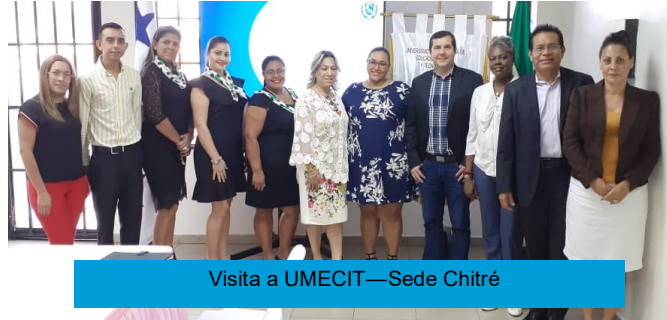
Visita a UMECIT—Sede Chitré