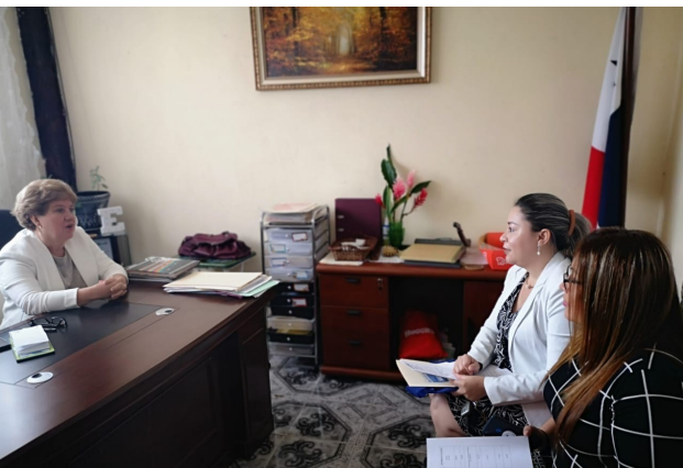
Visita de equipo fiscalizador de UNACHI al proyecto Universitario: Universidad Vanguardista Publies Educa, quienes están optando por la autorización de funcionamiento provisional en la República de Panamá.