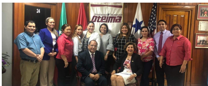
Visita a la Universidad Tecnológica OTEIMA— Sede David