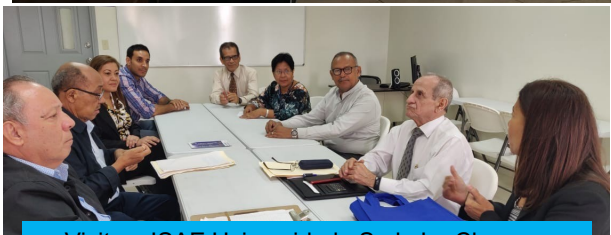
Visita a ISAE Universidad—Sede La Chorrera