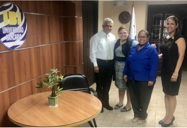
Proceso de Cierre Temporal de IBI Universidad Bancaria en presencia de Autoridades Académicas de IBI, Auditor Académico de CTDA y personal de CTDA.