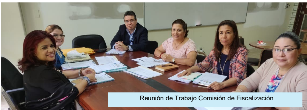
Reunión de Trabajo Comisión de Fiscalización