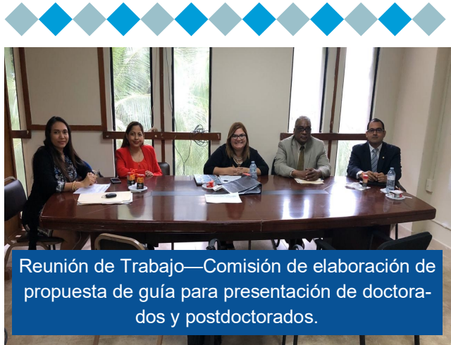
Reunión de Trabajo—Comisión de elaboración de propuesta de guía para presentación de doctorados y postdoctorados.

Colaboradores de la Comisión Técnica de Desarrollo Académico que la labor diaria trabajan por el cumplimiento de los valores de CTDA: