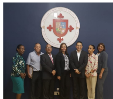
Visita a la USMA—Colón