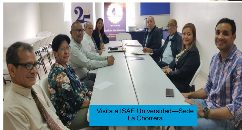
Visita a ISAE Universidad—Sede La Chorrera