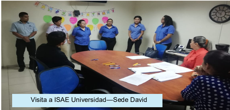
Visita a ISAE Universidad—Sede David