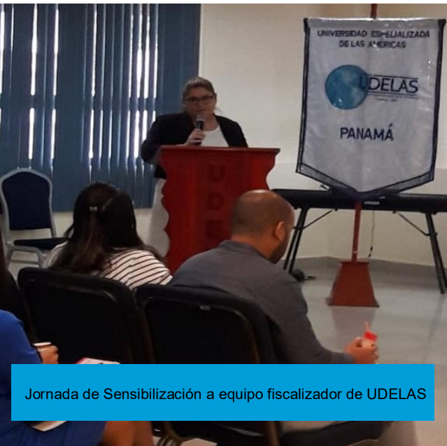
Jornada de Sensibilización a equipo fiscalizador de UDELAS