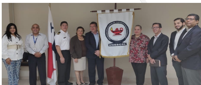
Visita a la Universidad Especializada del Contador Público Autorizado