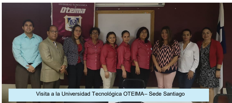
Visita a la Universidad Tecnológica OTEIMA– Sede Santiago

Visita a la Universidad Latina a la supervisión y seguimiento de la carrera de Doctor en Medicina y Cirugía. Sede Santiago