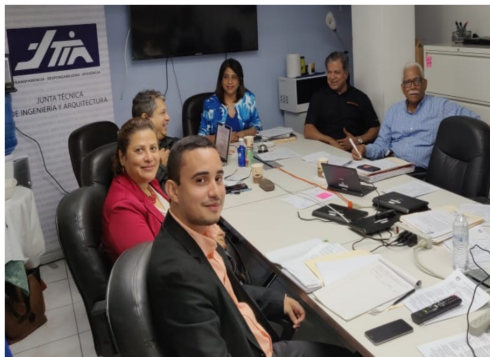
En la labor educativa de CTDA, personal de la Comisión se traslado a las instalaciones de la Junta Técnica de Ingeniería y Arquitectura a brindarle Servicios de Consultoría con miras a fortalecer los lazos entre ambos organismos en lo concerniente a la elaboración de Certificaciones de Títulos de las Universidades Particulares.