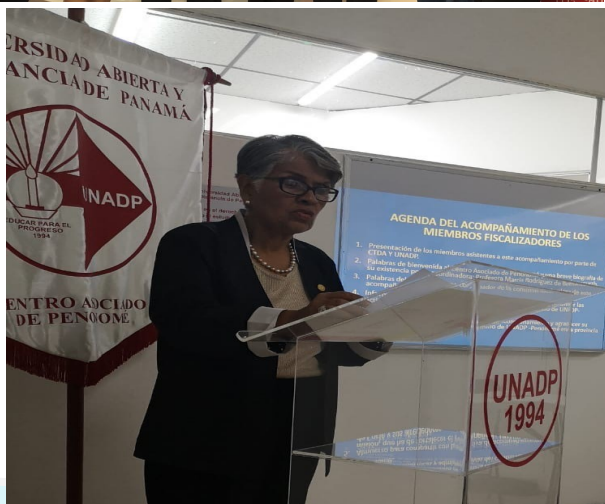
Visita a UNADP—Sede Penonomé