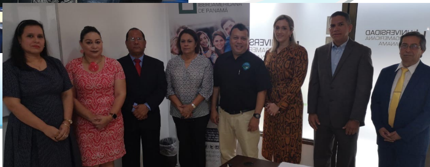
Visita a la Universidad Iberoamericana de Panamá Sede David