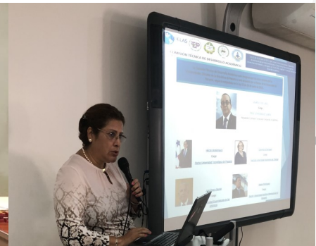
Jornada de Sensibilización para equipos fiscalizadores de Coclé, Santiago y Azuero