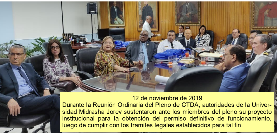
12 de noviembre de 2019 Durante la Reunión Ordinaria del Pleno de CTDA, autoridades de la Universidad Midrascha Jorev sustentaron ante los miembros del pleno su proyecto institucional para la obtención del permiso definitivo de funcionamiento, luego de cumplir con los tramites legales establecidos para tal fin.