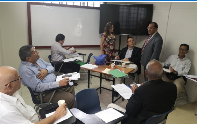
Visita a la Universidad del Arte Ganexa– Sede Santiago