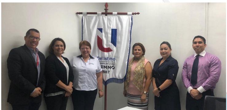
Visita a la Universidad del Istmo—Sede David