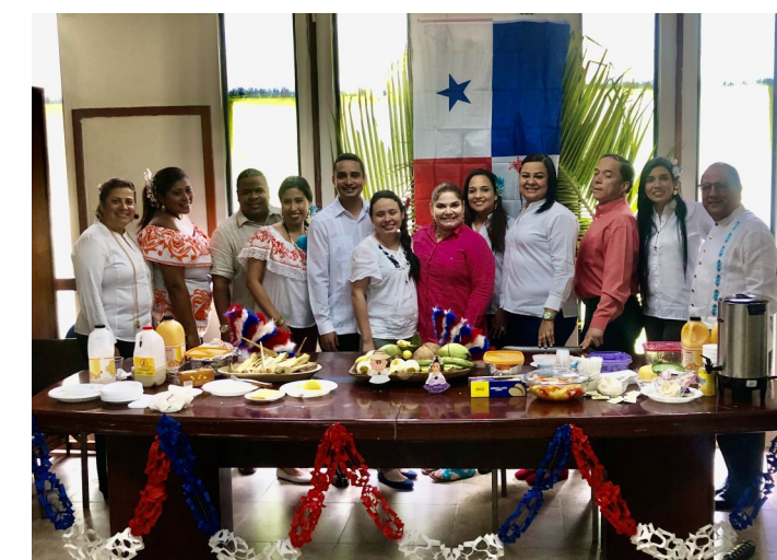
Desayuno Típico de los Colaboradores de CTDA