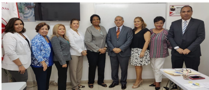
Visita a la Universidad Abierta y a Distancia de Panamá