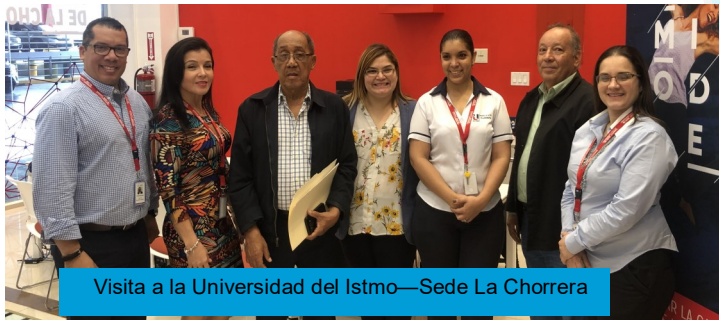
Visita a la Universidad del Istmo—Sede La Chorrera