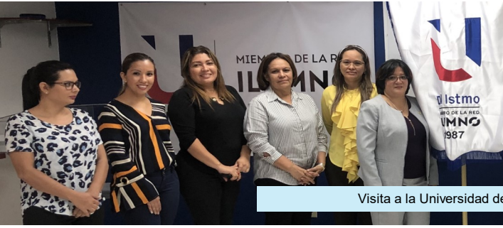
Visita a la Universidad del Istmo—Sede Santiago