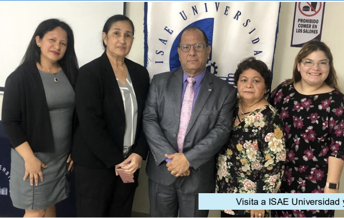
Visita a ISAE Universidad y a la Universidad Santa María La Antigua (USMA)—Sede Santiago