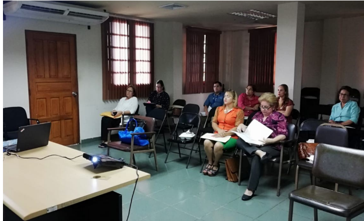
Jornada de Sensibilización realizada en la Gobernación de la Ciudad de David a las Universidades Particulares con sede principal en la Provincia de Chiriquí